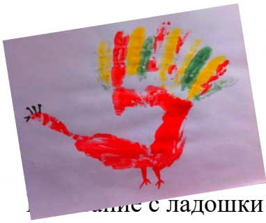
...ние с ладошки