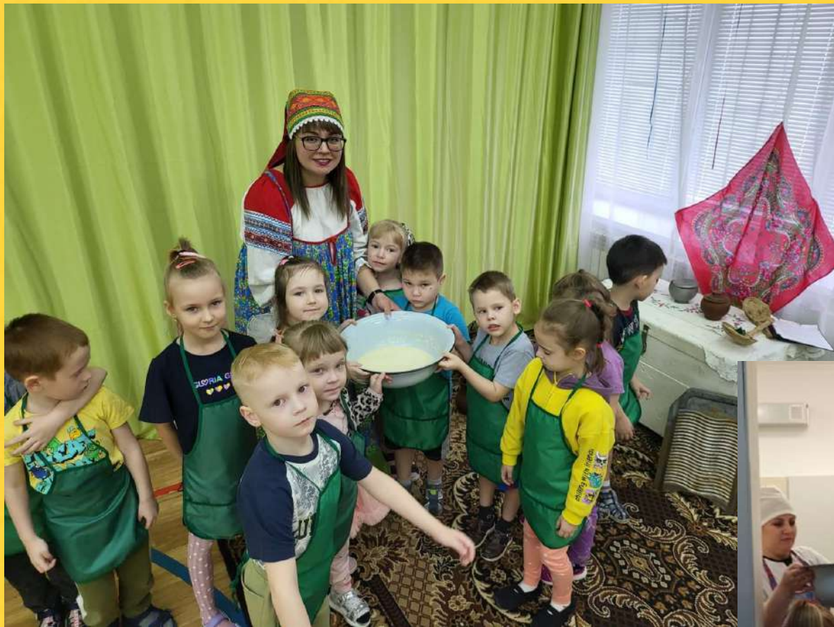
Передали тесто нашим поварам