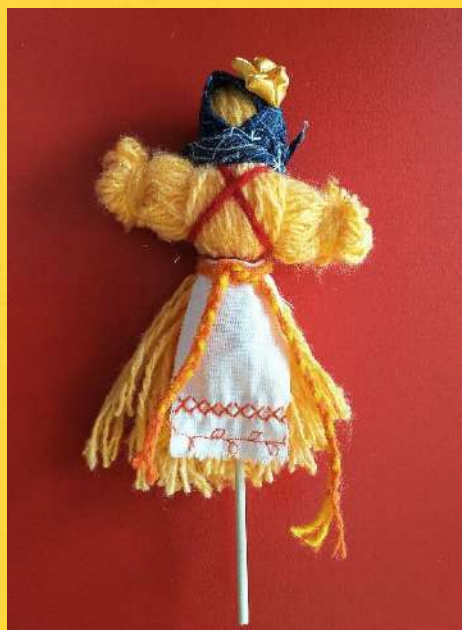
Мастер класс «Кукла масленица»